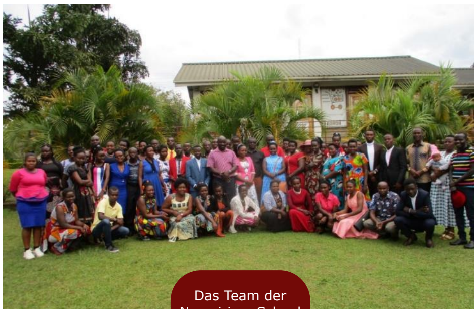
Das Team der Nyamirima School

Das Foto zeigt die Mitarbeiter der Nyamirima School. Zusammen leben wir das Motto der Schule: „Together hand in hand for life“.